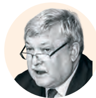
Sándor Csányi (67) 938 mil. €

1. Je generálnym riaditeľom OTP Bank Group, jednej z najväčších finančných skupín v regióne strednej a východnej Európy a najväčšej banky v Maďarsku. Pôsobí aj ako akcionár a člen predstavenstva maďarskej nadnárodnej ropnej a plynárenskej spoločnosti MOL Group. Prostredníctvom výrobcu potravín Bonafarm je vlastníkom rozsiahlych poľnohospodárskych pozemkov, patrí mu napríklad aj najväčší bitúnok v Maďarsku. Jeho zahraničné investície spravuje fond so sídlom v Singapure. Na riadení jeho podnikov sa aktívne podieľajú jeho dvaja dospelí synovia. V čele rebríčka najbohatších Maďarov je nepretržite už od roku 2010 a za posledných deväť rokov ho na prvej pozícii vystriedali iba dvaja iní podnikatelia - Gábor Várszegi, ktorý žije v USA a už sa stiahol z obchodného života, a developer Sándor Demján, ktorý zomrel pred tromi rokmi.